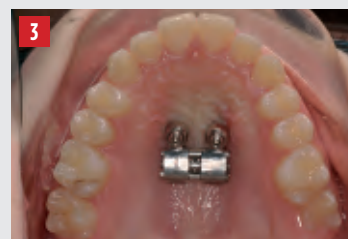
Sopra: singola seduta per applicazione di Miniviti e Dispositivo